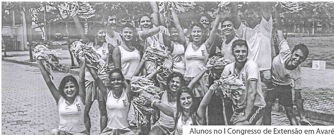
Alunos no I Congresso de Extensão em Avaré