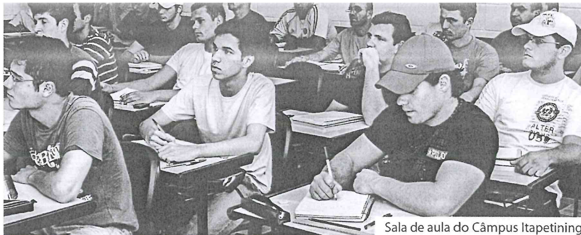
Sala de aula do Câmpus Itapetininga