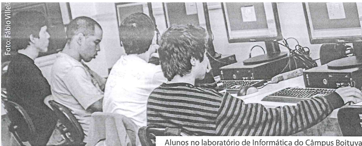
Alunos no laboratório de Informática do Câmpus Boituva